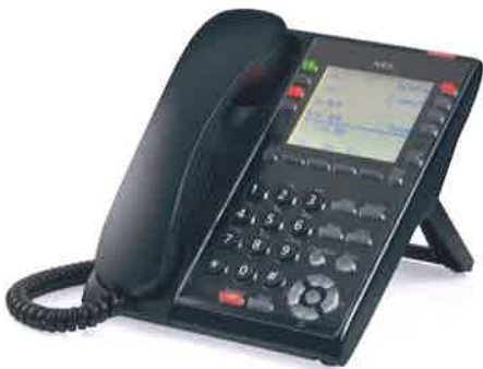
SL2100 IP 話機